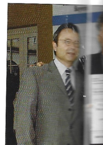
Erfolgreich mit einem Emma Klopff von Prokino.