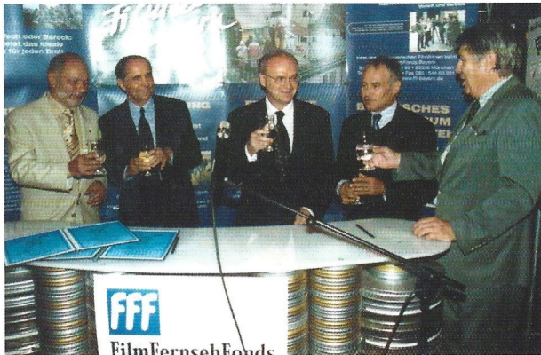
Die »Gründungsväter« der German Film Collection in the Harvard Film Archive